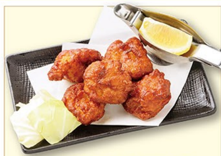
若鶏の唐揚げ 489円(税抜)