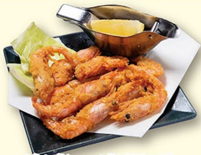
海老の唐揚げ 399円(税抜)