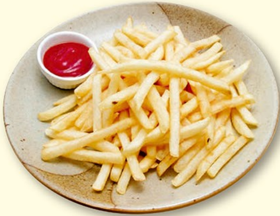
山盛り ポテトフライ 399円(税抜)