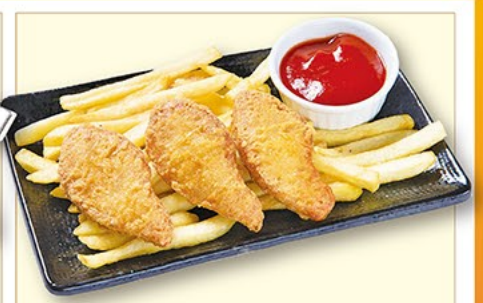
ポテチキコンビ 399円(税抜)